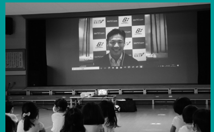
ラグビー元日本代表キャプテン廣瀬俊朗氏が、「ラグビー不毛の地」と呼ばれる鳥取県の幼稚園にラグビーボールを贈呈