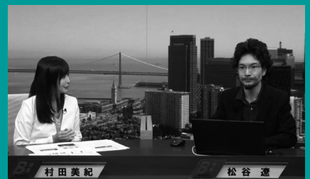
Business Breakthrough ch 「AR・VRが実現する社会」