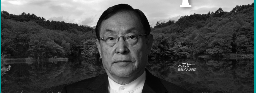
大前研一